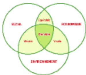
Schéma du développement durable : Solidarité - Précaution - Participation

Source : ministère de l'Écologie, de l'Énergie, du Développement durable et de l'Aménagement du territoire (1998).